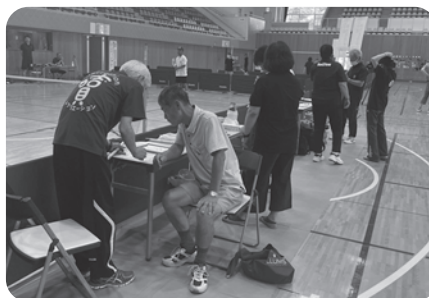
レク式体力チェック