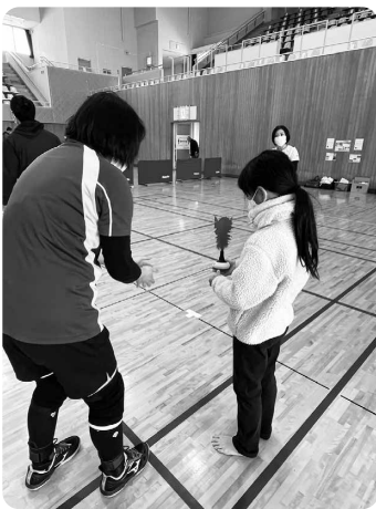
インディアカ (島根県インディアカ協会)