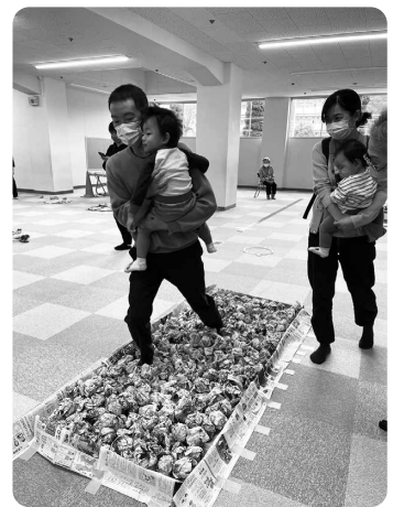
忍者ランド (浜田レクリエーション協会・益田市レクリエーション協会)