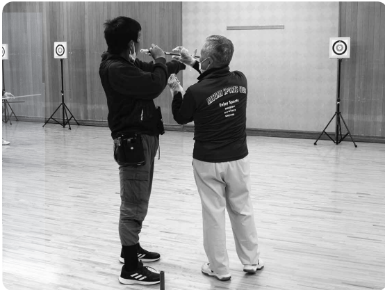
スポーツウエルネス吹矢 (島根県スポーツウエルネス吹矢協会)