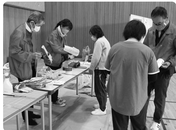
防災情報展示・防災グッズ作り (島根県子ども会連合会)