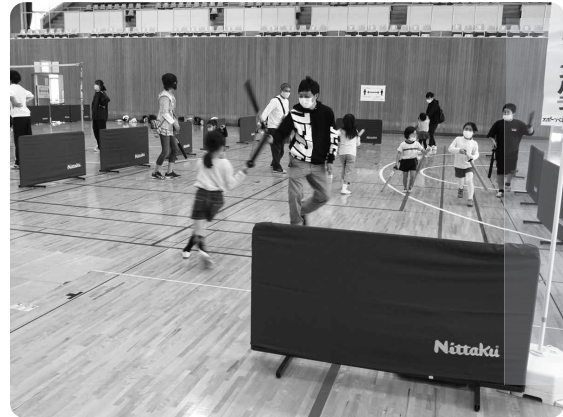
スポーツチャンバラ (島根県スポーツチャンバラ協会)