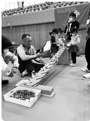
キャンプ用品展示 (島根県キャンプ協会)