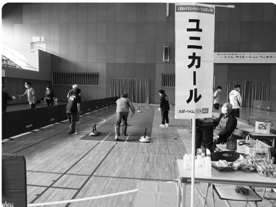
ユニカール (島根県ユニカール協会)