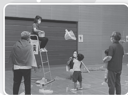
忍者ランド (島根県レクリエーション協会事業委員会)