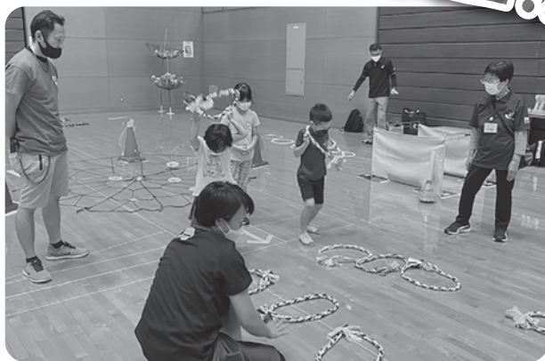
忍者ランド(島根県レクリエーション協会事業委員会)

9月23日(金)、出雲市の島根県立浜山体育館において、「しまねレクリエーションフェスティバル」を開催し、昨年度より多い300名を超えるご家族の皆さまが遊びに来てくださいました。