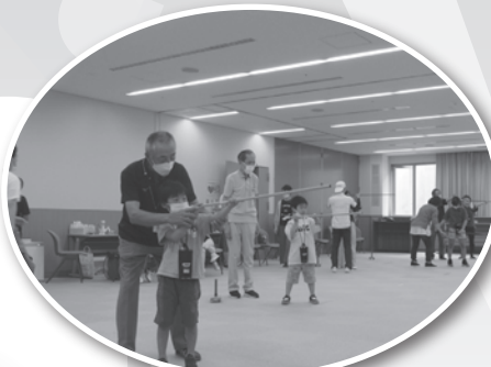
スポーツウエルネス吹矢 (島根県スポーツウエルネス吹矢協会)