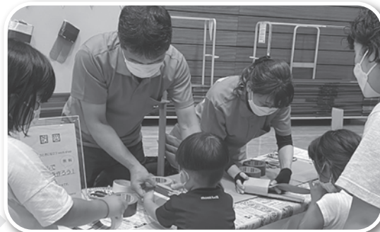
防災情報展示・段ボールスリッパ作り (島根県子ども会連合会)