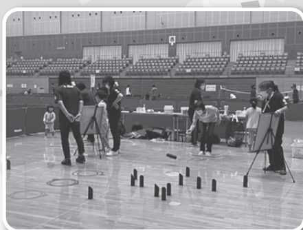
インドア・モルック (島根県レクリエーション協会スポレク推進委員会)