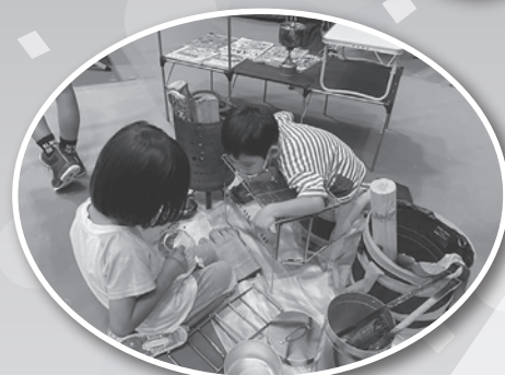
キャンプ用品展示 (島根県キャンプ協会)