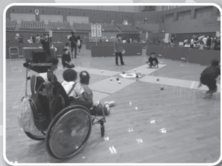
オーバルボール (まつえレクリエーション協会)