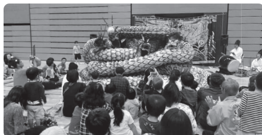
松江会場デモンストレーション（石見神楽）

今年度も、7月6日（土）浜田会場（島根県立体育館）、10月19日（土）松江会場（松江市総合体育館）の県内2会場で開催しました。フェスティバル開始前に運営スタッフ全員「あいサポート研修」を受講し、障がいのある方との接し方について学びました。スポーツ・レクリエーションを楽しく多くの方に伝えられるように意識を新たにしました。浜田会場では、昨年ラダーゲッターで交流のあった大田市の養護学校の生徒さんも応援にかけつけていただき、ラダーゲッター運営にボランティアとして協力していただきました。