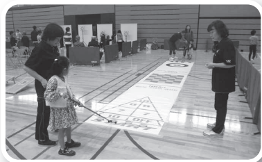
デッキスティックゲーム(安来レクリエーション協会)