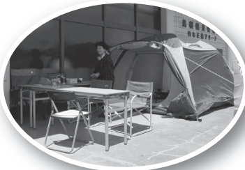
キャンプ展示(島根県キャンプ協会)