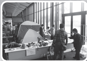
キャンプ展示(島根県キャンプ協会)