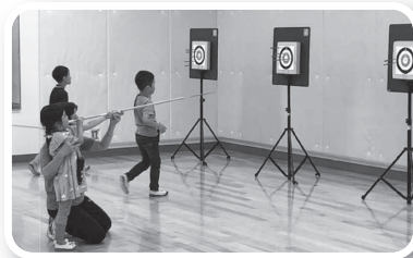
スポーツウエルネス吹矢(島根県スポーツウエルネス吹矢協会)