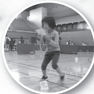
クイックオリエンテーリング (島根県オリエンテーリング協会)