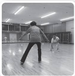
クイックオリエンテーリング (島根県オリエンテーリング協会)