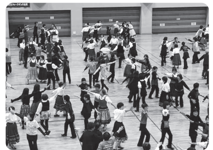
オープニング「365日の紙飛行機」