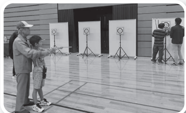
スポーツウエルネス吹矢(島根県スポーツウエルネス吹矢協会)