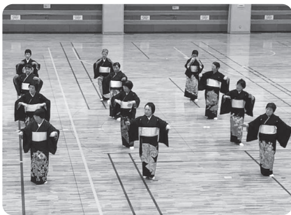
南部よしゃれ(斐川フォークダンス連盟)