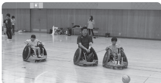
浜田会場デモンストレーション（車いすラグビー）