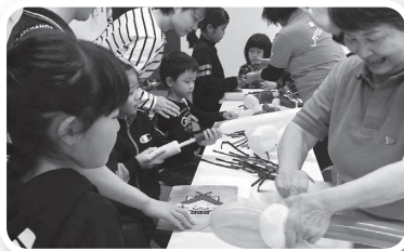
キッズコーナー(まつえレクリエーション協会、島根県レクリエーション協会)