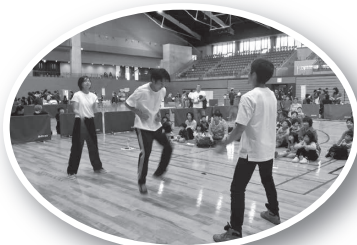
ダブルタッチ(岡山県ダブルタッチ協会)