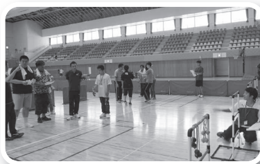
ラダーゲッター(島根県レクリエーション協会)