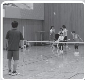
スポンジテニス(島根県スポンジテニス協会)