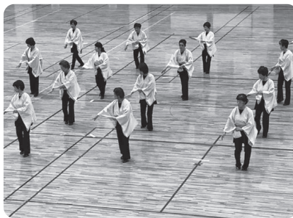
清水小唄(安来フォークダンス連盟)