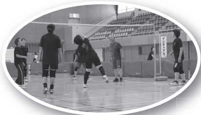
インディアカ(島根県インディアカ協会)