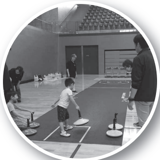
ユニカール(島根県ユニカール協会)