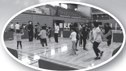
スポーツチャンバラ(島根県スポーツチャンバラ協会)