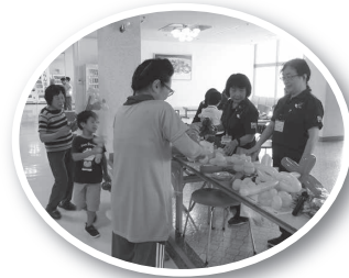
バルーンアート(浜田レクリエーション協会)