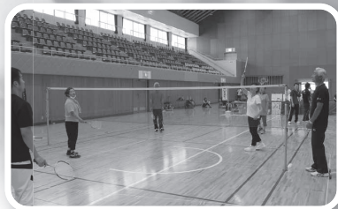
ファミリーバドミントン(島根県ファミリーバドミントン協会)