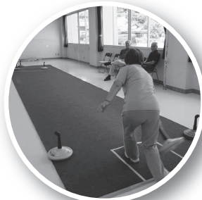
ユニカール(島根県ユニカール協会)