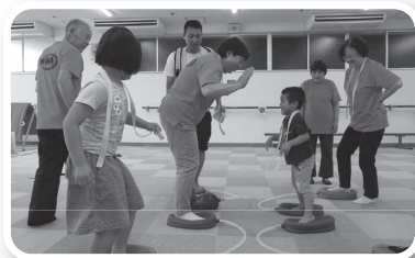
スポレク広場(益田市レクリエーション協会)