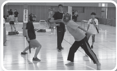
スポーツチャンバラ(島根県スポーツチャンバラ協会)