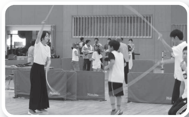
ダブルタッチ(岡山県ダブルタッチ協会)