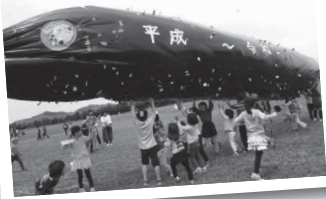
▲「第13回凧あげ&ニュースポーツの集い」