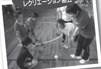
▲ さあ、みんなで体験しよう