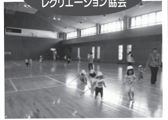
▲ 津和野あそびフェスタ2019