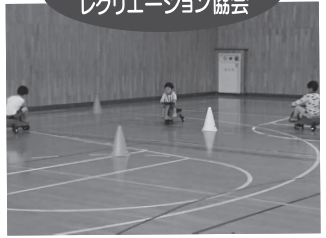
▲ あそびのコンビニ開店 inサンレイクpart