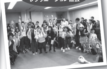
▲ 第32回浜田市ウォークラリー大会