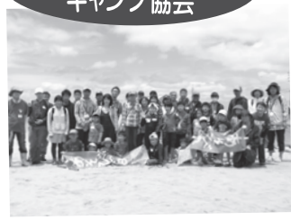
▲ キッズ海の遊び「ディキャンプ」