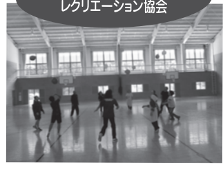
▲ 「津和野あそびフェスタ2018」