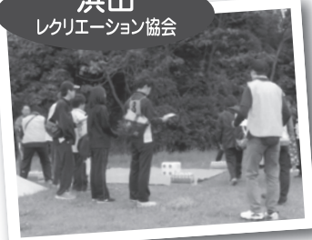
▲ 「浜田市ウォークラリー大会」