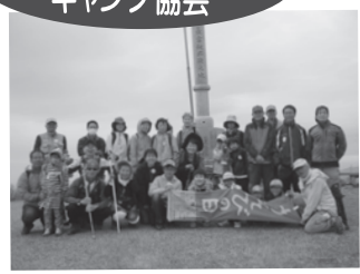
▲ キッズ山の遊び「カタクリの花登山」