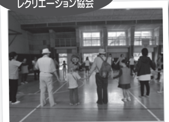
▲ 「世界遺産を歩いてみよう(11)」