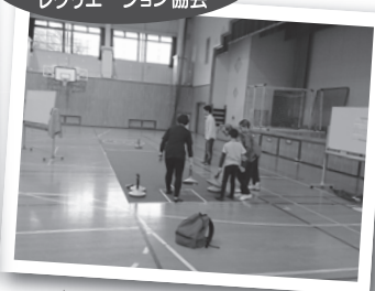
▲ 「あそびのコンビニ開店」