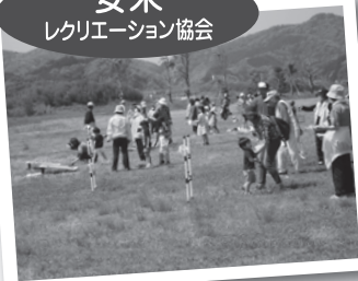
▲「第12回凧あげ&ニュースポーツの集い」