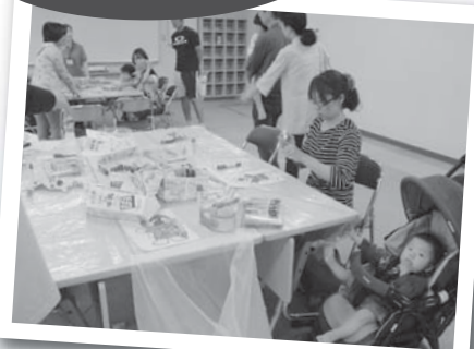
▲「あそびのコンビニ開店2016」