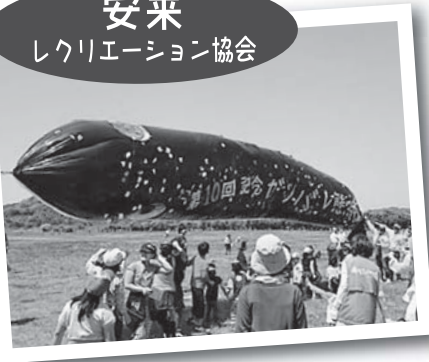
▲「第10回凧揚げ&ニュースポーツの集い」