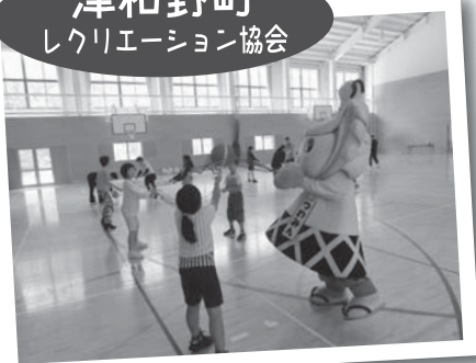
▲「津和野あそびフェスタ2016」