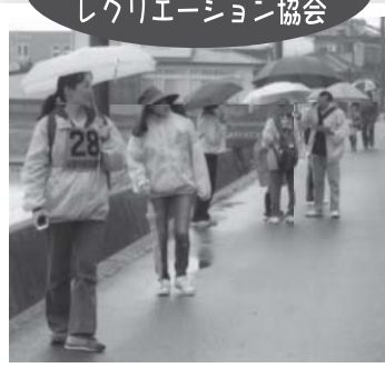
▲「第29回浜田市ウォークラリー大会」