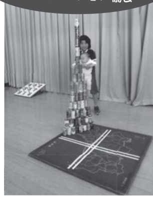
▲「さあ、みんなで遊ぼう!!」